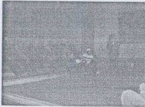
Estudiantes de Chinautla